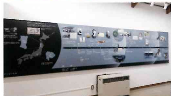
クニマスの歩んだ歴史を紹介