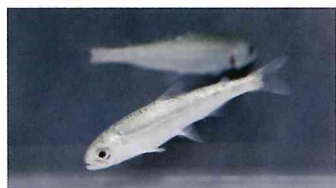
人工孵化したクニマスの稚魚