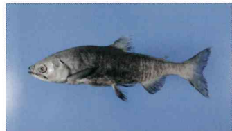
西湖で2010年に初めて確認されたクニマス標本