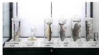
西湖で採取されたクニマス・人工孵化したクニマス標本