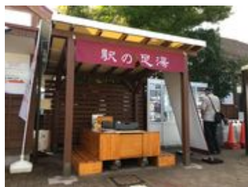
河口湖駅 駅の足湯