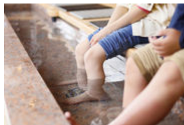
富士河口湖温泉郷自慢の足湯です