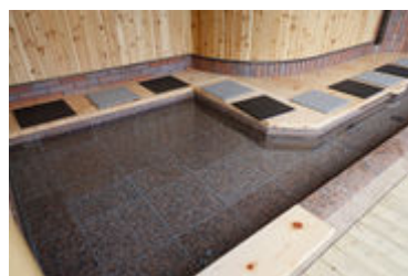
広々と利用できるのでソーシャルディスタンスも保てます