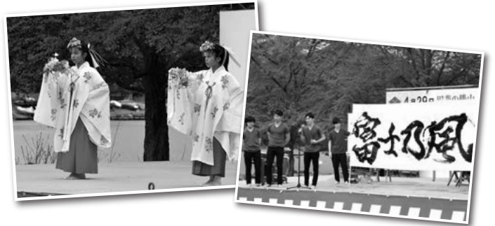
※イベント内容は急遽変更・中止になる場合がございます。 (Event content is subject to change or cancellation at short notice.)