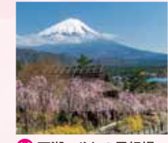
14 西湖いやしの里根場

西湖野鳥の森公園 Saiko Yacho-no-Mori Park (Wild Bird Forest)