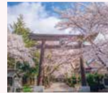
12 富士御室浅間神社

大石公園/ 河口湖自然生活館 Oishi Park/ Kawaguchiko Natural Living Center