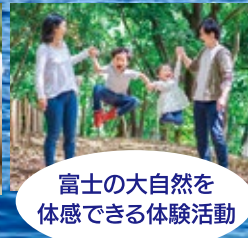
富士の大自然を体感できる体験活動