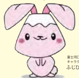
富士河口湖町 キャラクター ふじびよん