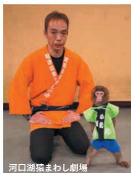
河口湖猿まわし劇場

開催日時 2023年3月25日(土) 11時~16時 主催 (一社) 富士河口湖町観光連盟